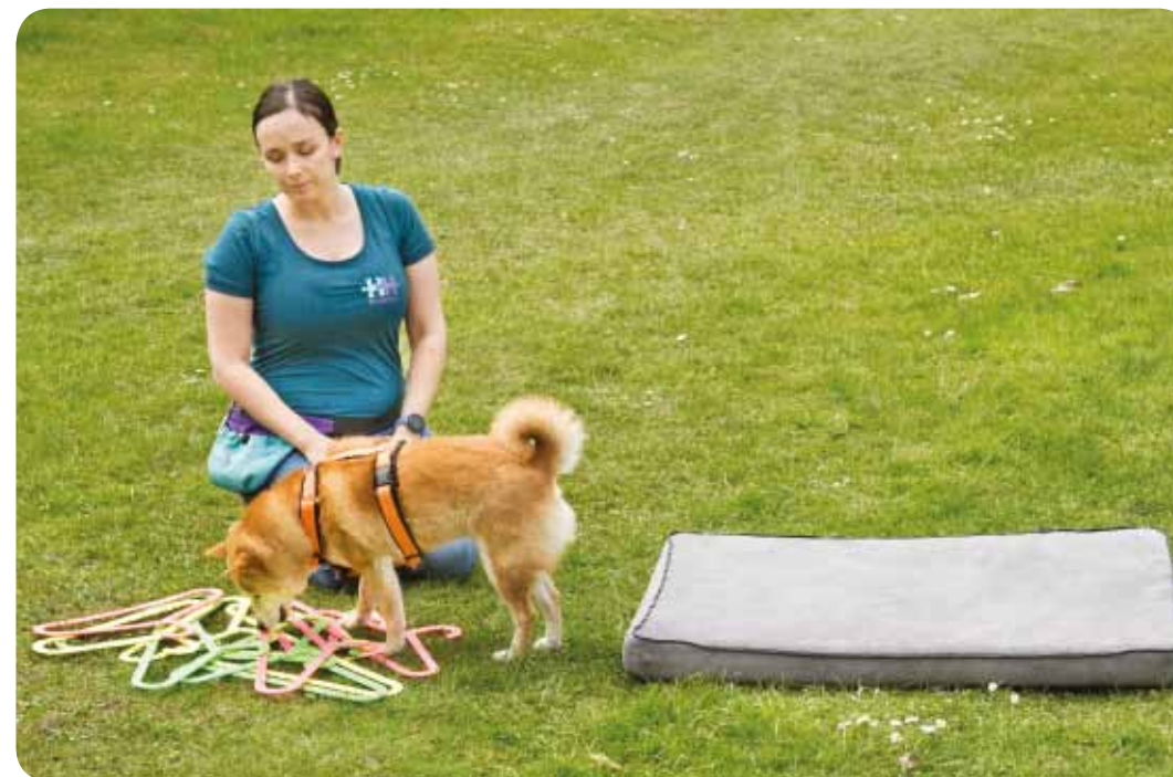
V Hersenwerku není možné chybovat. Pes si sám vybere způsob řešení, hraje pro sebe a zcela dobrovolně. Každý hlavolam by měl psovi pasovat na míru podle jeho potřeb.

Nejvíce takových materiálů většina lidí najde ve svém domově – z nich pak tvoříme různé čuchací dečky, muffinovníky, koberec pro rolování, brčka v lavorech a mnohé další. Nicméně nesmíme zapomenout na prostředí, které nám nabízí mnoho variant na skvělé hlavolamy, a to je PŘÍRODA.