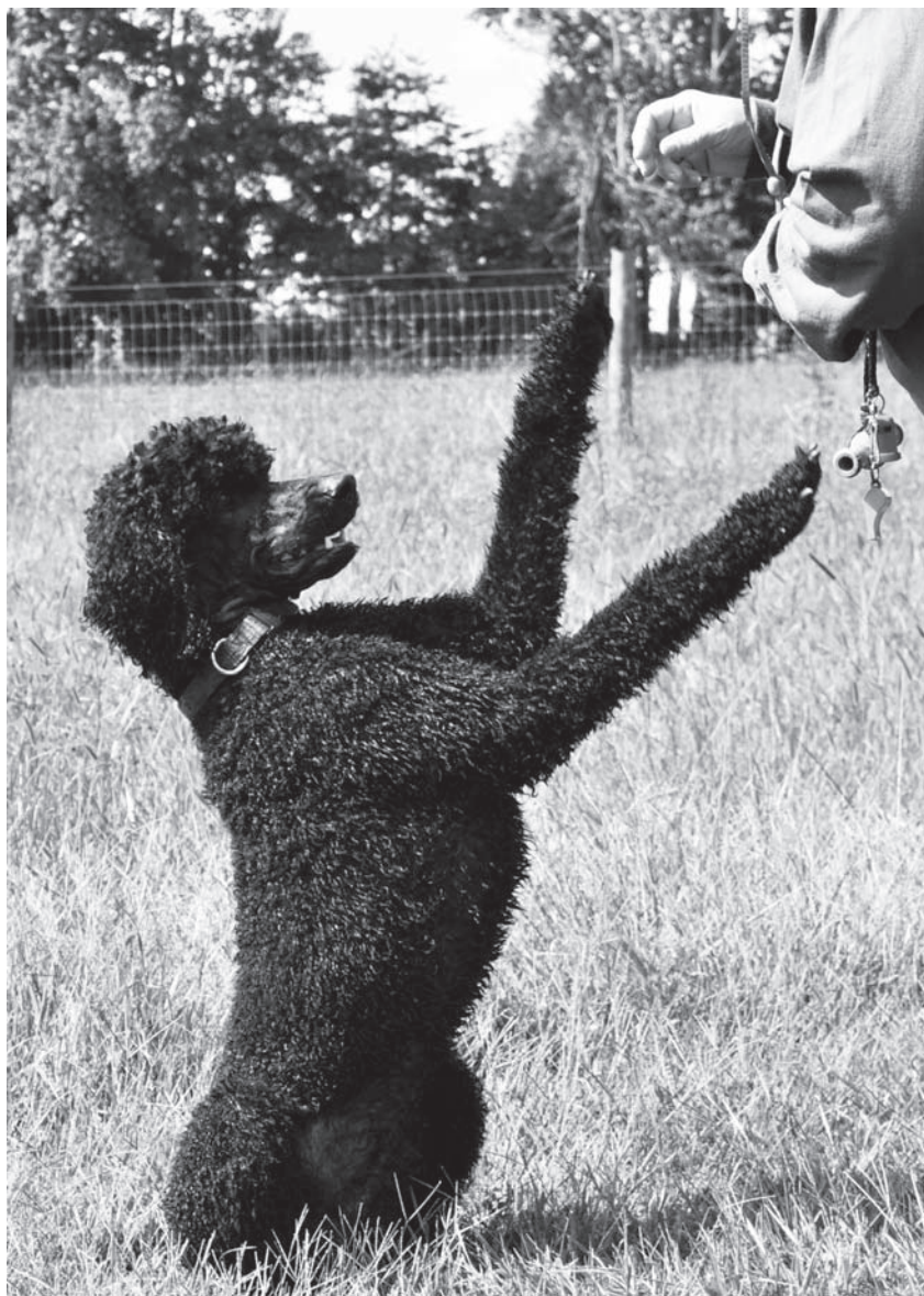
Deacon si během úvodního výcviku osvojil víc než jen poslušnost; naučil se i pár triků!