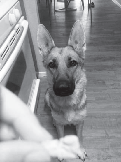
Nala doma dokonale sedne na povel za pamlskek!