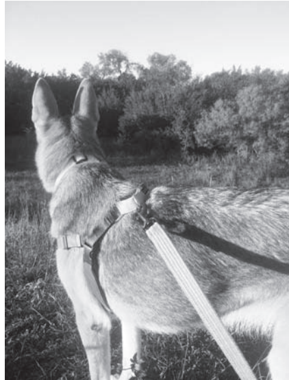
Ale ještě stále se učí spolupracovat mimo domov a bez pamlsku.

vedlejší místnosti. Oba tyto problémy – strach a rušivá lákadla – jsou reálné a rodiče po celém světě je dobře znají. A můžete si nad tím zoufat nebo se rozčilovat, ale tím, že to svému dítěti dáte najevo, nijak nezměníte realitu; váš ptáček zpěváček teď prostě zpívat nebude. Vaše dítě se může vystupování na veřejnosti časem naučit, ale protože tato kniha je věnována výcviku psů a nikoli výchově dětí, tak se tím teď nemůžeme zabývat. Popovídejme si namísto toho o psech.