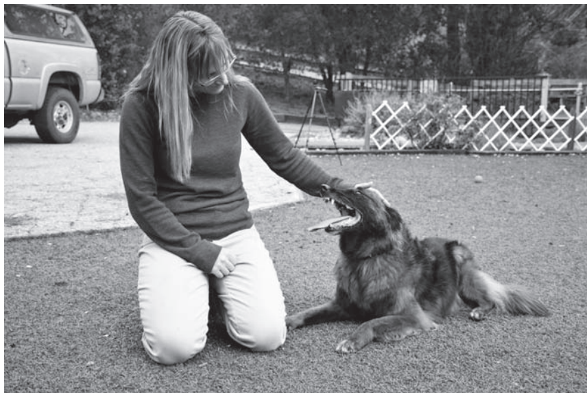
Autorka odpočívá se svým psem Raikou.

dennodenně v kuchyni. Také vám garantuji, že to nefunguje tak, že by majitel prostě jednoho dne vzal psa ven, odepnul mu vodítko, v duchu se pomodlil a pes hned začal plnit povely před kamerami.