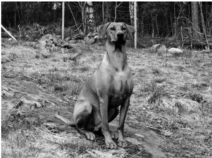
Jeden z mých pinčů, Zorro. Na s. 10 je můj druhý pinč, Knøttet.

rentgenem potvrzeno, že má lokty a kyčle v pořádku. Oči je třeba vyšetřit a kolena zkontrolovat. U některých plemen jsou požadována i některá další specifická vyšetření. Proto je vhodné se předem seznámit s požadavky, kladené na vaše vybrané plemeno. Když jste si vybrali křížence dvou plemen, je toho dvakrát tolik.