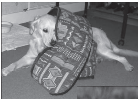
Obr. 1 Honey, pes domácí (canis familiaris) žvýkající svůj pelíšek!

Dříve než předložím fakta, která, jak doufám, sesadí z trůnu teorii pravidel smečky, je mi důležité vysvětlit, proč pes není vlk. Dle taxonomie Clutton-Brocka (1999), se do čeledi Canidae (psoviti) řadí 38 rodů. Patří mezi ně i vlk obecný ( Canis lupus ), u kterého, jak dobře víme, všechno začalo. A také pes domácí ( Canis familiaris ), jak ho známe dnes.