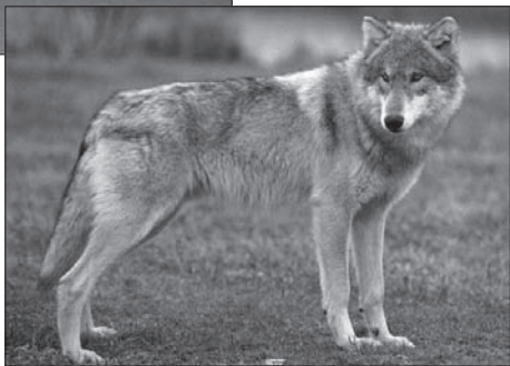
Obr. 2 Canis Lupus (vlk obecný)