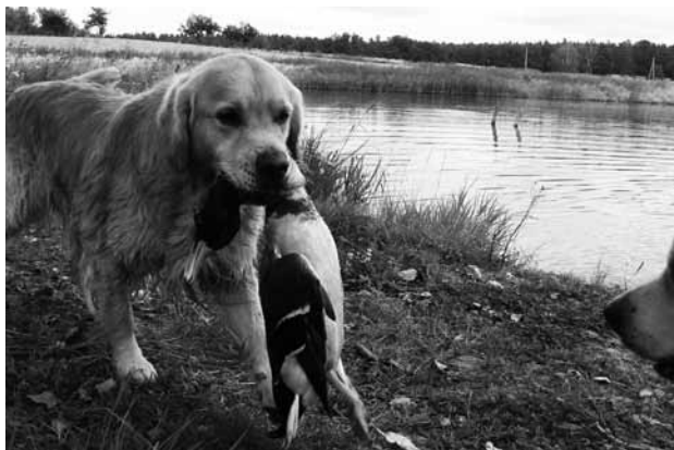
Hon na kachny – doména retrívrů.

čtrnáctiměsíčním loveckým psem, který v tomto věku začínal, stejně jako my, vůdci, od samého základu.